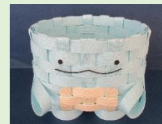
③すみっこぐらし とかげ