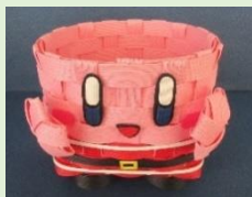
①カービー サンタバージョン