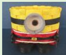
②ミニオン サンタバージョン